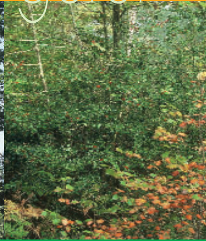
▲ LES MONOCULTURES DE GRANDE AMPLEUR SONT FRAGILES.