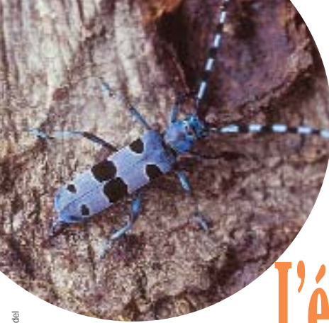
ROSALIE. CAPRICORNE VIVANT DANS LE BOIS MORT (HÊTRE)