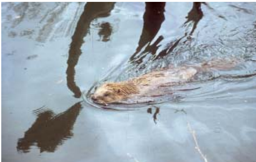
CASTOR, UN EXEMPLE D'ESPÈCES PARMIS LES «INGÉNIEURS ÉCOLOGIQUES» DANS LA FORMATION D'HABITATS NOUVEAUX.

Le paysage naturel, un vaste massif forestier par exemple, est un système biologique spatialement hétérogène même si les conditions de sol et de climat sont