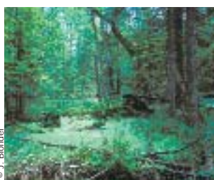
CLAIRIÈRE DANS LA FORÊT PRIMAIRE DE BIALOWIEZA.

>>> Jacques Blondel Cefe-CNRS 1919, route de Mende 34293 Montpellier cedex 5 Tél. : 04 67 61 32 10 blondel@cefe.cnrs-mop.fr