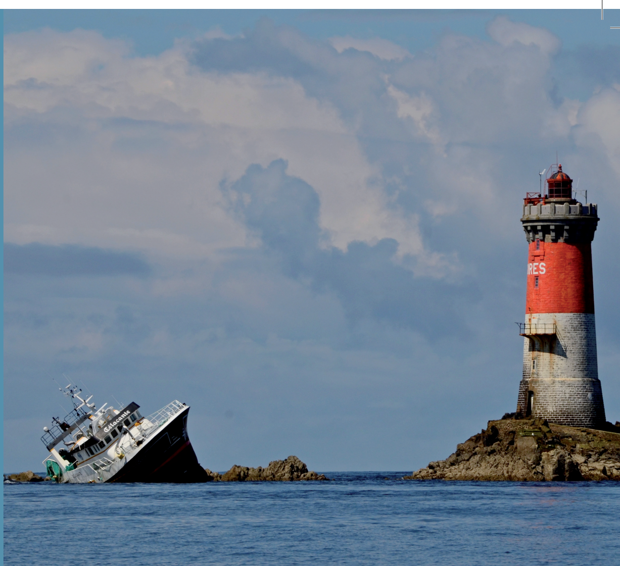
Le Célaçante, un navire de pêche de 25 mètres a échoué sur les rochers, au pied du phare des Pierres-Noires, au large